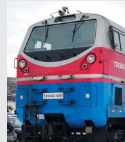
Diesel locomotive TE33A General Electric Тепловоз ТЭ33 Дженерал Электрик

Glass products with electrical heating system for the driver's cab of electric trains, electric locomotives, diesel locomotives, rail buses and other rolling stock of railways – glazing of front, side glazing, top glazing, spot-light glazing, headlamp glazing, the route pointer glazing, glazing of buffer lantern.