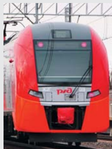
Electric train Desiro (Swallow) LLC "Ural Locomotives", Siemens AG Электропоезд Desiro (Ласточка) ООО «Уральские локомотивы», Сименс АГ