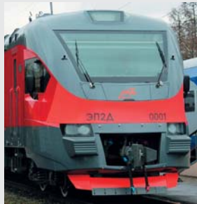
Electric train EP2D Transmashholding, Demikhovsky plant Электропоезд ЭП2Д Трансмашхолдинг, Демиховский завод