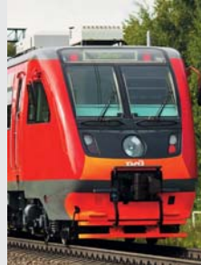
Rail bus RA2, model 750 Transmashholding, Metrovagonmash Рельсовый автобус РА2, модель 750 Трансмашхолдинг, Метровгонмаш