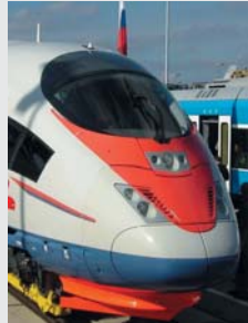
High-speed electric train Sapsan Siemens AG Скоростной электропоезд Сапсан Сименс АГ