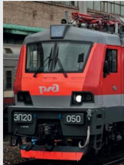
Electric locomotive EP20 Transmashholding, NEVZ, Alstom Электровоз ЭП20 Трансмашхолдинг, НЭВЗ, Альстом

В ООО «Мосавтостекло» разработана и внедрена система менеджмента качества в соответствии с ГОСТ Р ИСО 9001-2011. Планируемый срок внедрения системы IRIS (международного стандарта железнодорожной промышленности) — I полугодие 2018 года.