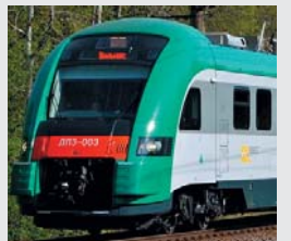
Diesel train DPZ