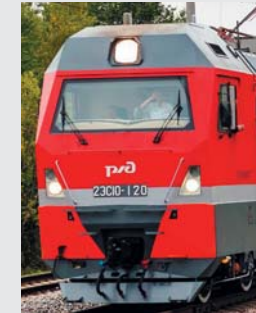
Electric locomotive 2ES10 LLC "Ural Locomotives" Sinara, Siemens AG Электровоз 2ЭС10 ООО «Уральские локомотивы» Синара, Сименс АГ